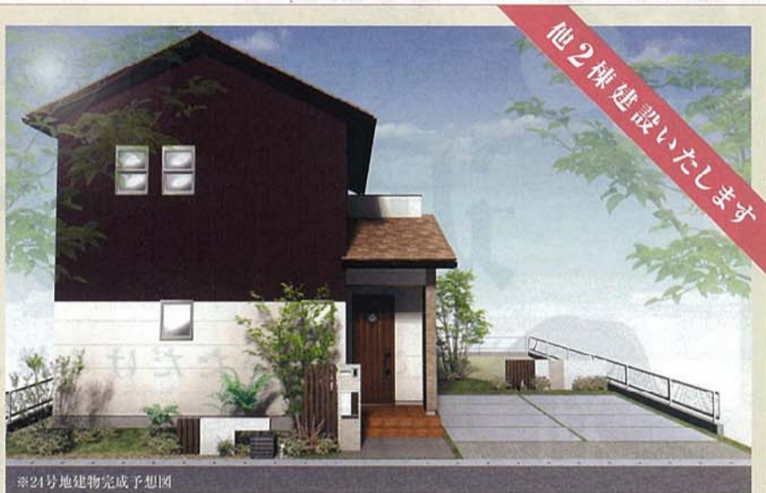
※24号地建物完成予想図

〈団地概要〉 ●名称/レセンテガーデン折尾東 ●所在地/北九州市八幡西区中須1丁目2336-1他 ●交通/市営「折尾中学校前」バス停徒歩1分(50m) ●地目/宅地 ●用途地域/準工業地域 ●建ぺい率/60% ●容積率/200% ●私道負担/なし ●道路アスファルト舗装幅員6m ●電気/九州電力 ●上下水道/北九州市営上下水道 ●開発総面積/8140.71㎡ ●開発許可番号/北九州市指令建都指第22127号 ●学校/折尾東小学校・折尾中学校 ●建築条件付宅地概要 ●販売区画数/30区画 ●敷地面積/180.00㎡~190.68㎡ ●販売価格/未定 ●最多販売価格帯/未定 ●土地売主/株式会社オオタニ [宅建業免許/福岡県知事(3)第13402号] ●販売/株式会社アヴェル・エステート [宅建業免許/広島県知事(3)第008801号] 広告有効期限/平成23年12月末日