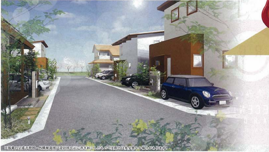
※掲載の完成予想図・外構植栽図は設計図を元に書き起こしたもので実際とは多少異なる場合があります。