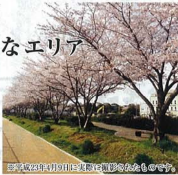
※平成23年4月9日に実際に撮影されたものです。

住環境の整った街に新しく広がるエリア、心地よく調和のとれた街並は毎日の生活を素敵に創造。微笑みの桜並木遊歩道、公園を散歩しながらゆったりとした時間を満喫。都市機能と自然が感じられる理想的な立地のレセンテガーデン折尾東なら、あなたの将来への夢もきっと無限に広がることでしょう。